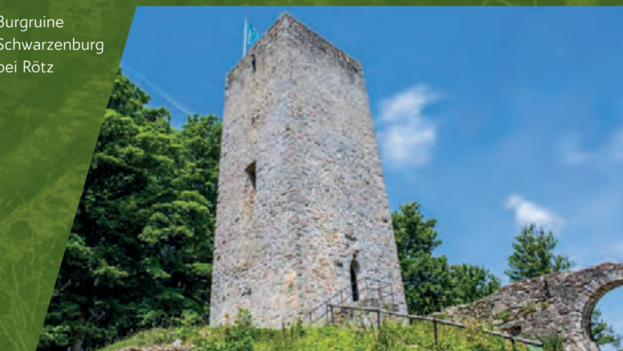
Burgruine Schwarzenburg bei Rötz

Heute wird die frei zugängliche Burgruine im Bereich der Vorburg größtenteils als Tribüne für die jährlich stattfindenden Festspiele (Märchenzeit) genutzt, im Bereich der Hauptburg befindet sich eine zeitweise bewirtschaftete Schutzhütte mit Biergarten. Der begehrte Bergfried dient als Aussichtsturm.