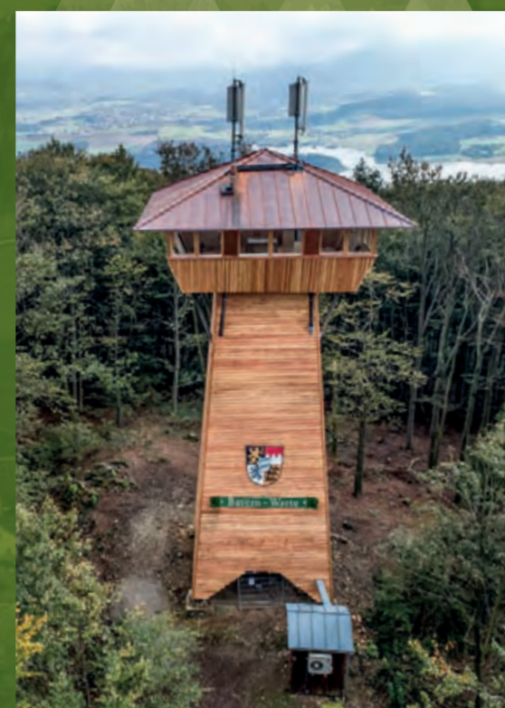
Der komplett sanierte Aussichtsturm auf dem Dieberg

Der Schlosshügel Altenschneeberg ist ein Ort für Spurensucher: Überreste des mittelalterlichen Burgstalls sind erkennbar zwischen malerischen Felsen (Naturdenkmal) und einer blütenreichen Magerrasenvegetation. Im Sommer 2019 wurde das Gipfelkreuz erneuert und ein Infopavillon im Zugangsbereich errichtet.