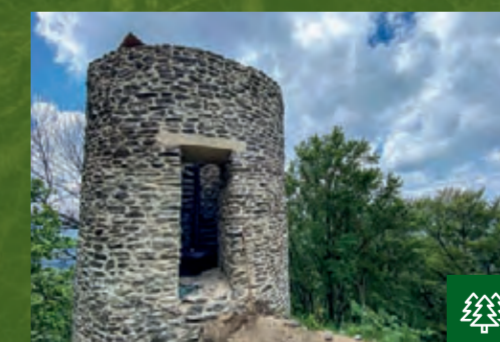
Reste der Burgruine

ORT Mnichov (CZ) HÖHE 878 Meter NN GPS 49.47223N / 12.71406E