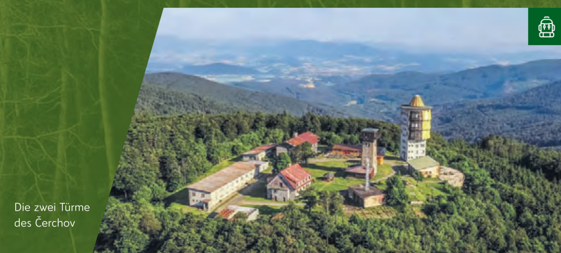
Die zwei Türme des Čerchov

Wieder am Boden kann man die Salve Regina-Kapelle besuchen und – nur mit Führung – einen Blick in das freigelegte mittelalterliche Bergwerk, das sogenannte Schrazelloch riskieren.