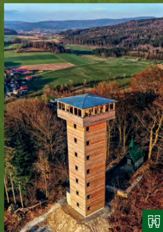
Der neue Aussichtsturm auf dem Bleschenberg

ORT Waldmünchen – Sinzendorf HÖHE 590 Meter NN GPS 49.33180N / 12.65582E